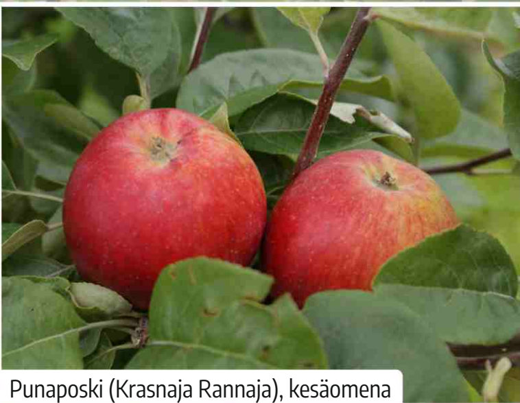
Punaposki (Krasnaja Rannaja), kesäomena